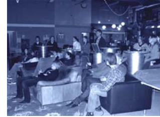
...och i Järfälla