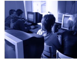
Trialogen i Smedjebacken

"Hur har jag upplevt att eleverna på min skola kunnat vara delaktiga hittills? Hur tycker jag att det borde vara?" Fråga för fråga, ärende för ärende i skolverksamheten utvärderas och målsätts. Därefter sammanställs resultatet i rapportform.