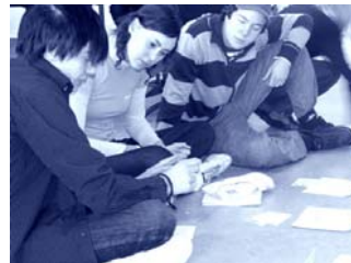
Workshop i Dals Ed...

Parterna utbildas var för sig i en mix av föreläsning och workshop. Delaktighetstrappan med dess tio steg introduceras och anknyts till skolans vardag genom mycket konkreta exempel på elevinflytande i övergripande skolfrågor och i lärandesituationer – klassrumsfrågor.