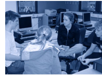
Trialogen i Edsbyn (gy)