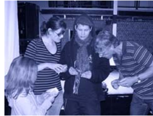
Utbildning i Umeå...

Utvecklingsprocessen på din skola inleds med att en projektgrupp bildas. För bästa resultat bör representanter från såväl skolledning och elevråd som lärarpersonal (samt föräldrar?) ingå i gruppen. Här förankras och planeras varje delmoment i processen. Alla parter ska exempelvis kunna påverka enkätens innehåll. Trialog handleder och supportar genom hela processen i enlighet med projektgruppens planering.