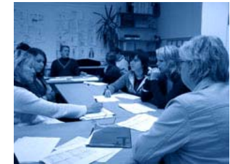
...och dialog i Smedjebacken