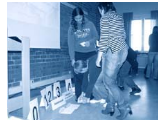
...och i Smedjebacken